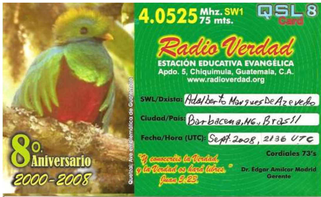
Cartão QSL da Radio Verdad

Mesmo com todos os problemas por que passa o país, temos duas transmissões em Ondas Tropicais sendo mantidas no Zimbabwe. A Radio Zimbabwe e a Voz do Zimbabwe estão sendo captadas nas frequências de 3.396 kHz e 4.828 kHz.