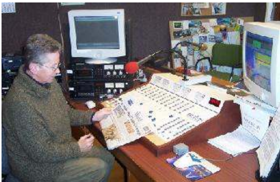
Estúdios da ZLXA

A Rádio ZLXA, que emite em 3.935 kHz, com um transmissor, Bauer 701b (IC), de 1 kw, alimentando uma antena dipolo de meia onda, em montagem Sloper, direcionada no sentido NE/SW,